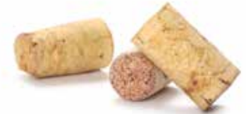
Kork gilt als einer der besten ökologischen Dämmstoffe

Besonders kostengünstig ist die Hohlraumdämmung . Dafür nutzt man die 1,5 bis 10 cm starke Luftschicht zwischen innerem und äußerem Mauerwerk. Die meisten bis 1973 in Norddeutschland gebauten