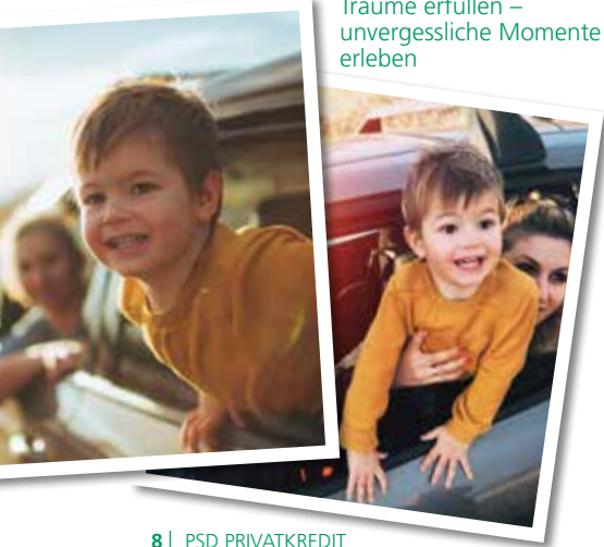
Träume erfüllen – unvergessliche Momente erleben

Statt einer vorschnellen Entscheidung für den Kredit vom Autohaus lohnt es sich, die Angebote der Banken zu prüfen. Auch hier ist das „Kleingedruckte“ zu beachten: Viele Kreditinstitute kommunizieren bei den Ratenkrediten mit einer „Von-bis“- oder auch „Ab“-Kondition. Letztlich bedeutet es, dass nur wenige Kunden tatsächlich den niedrigen Zinssatz aus der Werbung erhalten. Hinterfragen Sie darum genau, welche Rate am Ende des Tages tatsächlich für Sie auf dem Papier steht und wie hoch die Gesamtkosten des Kredits am Ende der Laufzeit sind.