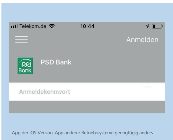
App der iOS-Version, App anderer Betriebssysteme geringfügig anders.

» Öffnen Sie die App. Melden Sie sich mit Ihrem PSD-Key und Ihrer Bankleitzahl an. Legen Sie ein Anmeldekennwort für die SecureGo-App fest. Das Kennwort benötigen Sie künftig für jede Anmeldung in der SecureGo-App.